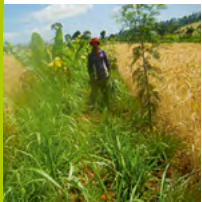
Kleinbäuerliche Initiativen zum Schutz der Umwelt, wie z. B. reduzierter Pestizideinsatz, verringern die Produktionskosten und den Wasserverbrauch, während sich Ernteerträge und Bodenqualität verbesserten.

Die Landwirtschaft ist bis heute die wichtigste Erwerbsquelle und der größte Wirtschaftszweig der Welt. 90 % der 525 Mio. landwirtschaftlichen Betriebe weltweit sind kleinbäuerliche Betriebe (< 2 ha) und Existenzgrundlage für 86 % der ländlichen Bevölkerung. Sie tragen substantiell zur Nahrungsmittelproduktion bei: Kleinbäuerliche Betriebe produzieren 80 % der Nahrungsmittel in den Ländern des Südens (in Afrika sogar 90 %). Sie ernähren 65 % der Weltbevölkerung. 18 Kleinbäuerliche Initiativen zum Schutz der Umwelt, wie z. B. reduzierter Pestizideinsatz, verringern die Produktionskosten und den Wasserverbrauch, während sich Ernteerträge und Bodenqualität verbesserten. Die Produktivität pro Fläche und Energieeffizienz ist bei kleinen und diversifizierten Bauernhöfen viel höher als bei Systemen, die vor allem externe Inputs (fossile Energie, chemischer Dünger, HochleistungsSaatgut) nutzen. Als neues Paradigma der Landwirtschaft des 21. Jahrhunderts formuliert der Weltagrarbericht: „Kleinbäuerliche, arbeitsintensivere und die auf Vielfalt ausgerichteten Strukturen sind die Garanten einer sozialwirtschaftlich und ökologisch nachhaltigen Lebensmittelversorgung durch widerstandsfähige Anbau und Verteilungssysteme. Gerade deshalb sind Investitionen in die kleinbäuerliche Produktion das dringendste, sicherste und vielversprechendste Mittel, um Hunger und Fehlernährung zu